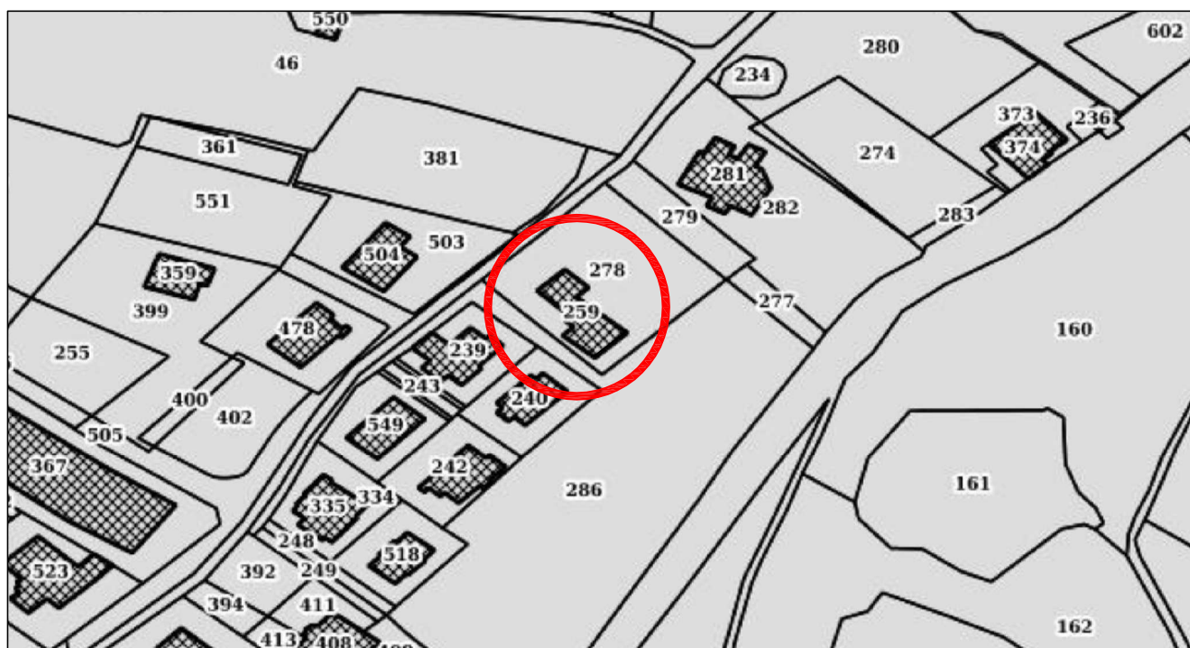
Comune di VIGGIANELLO - Via Carella, 25 - Foglio 80 P.IIa 259 Sub 2 - 4