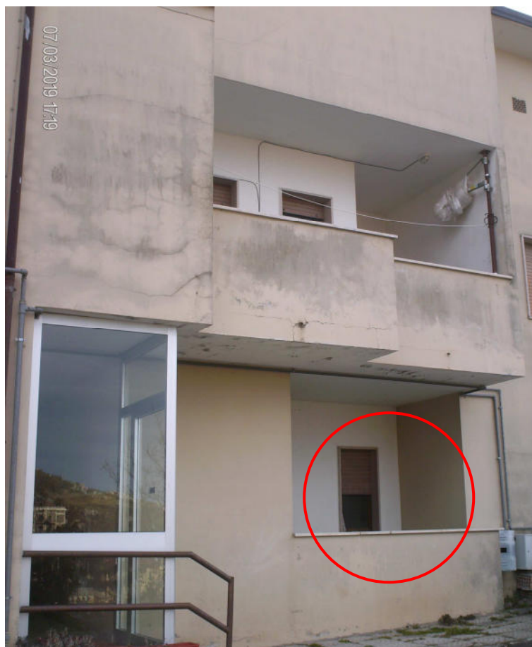
Prospetto su ingresso scala B