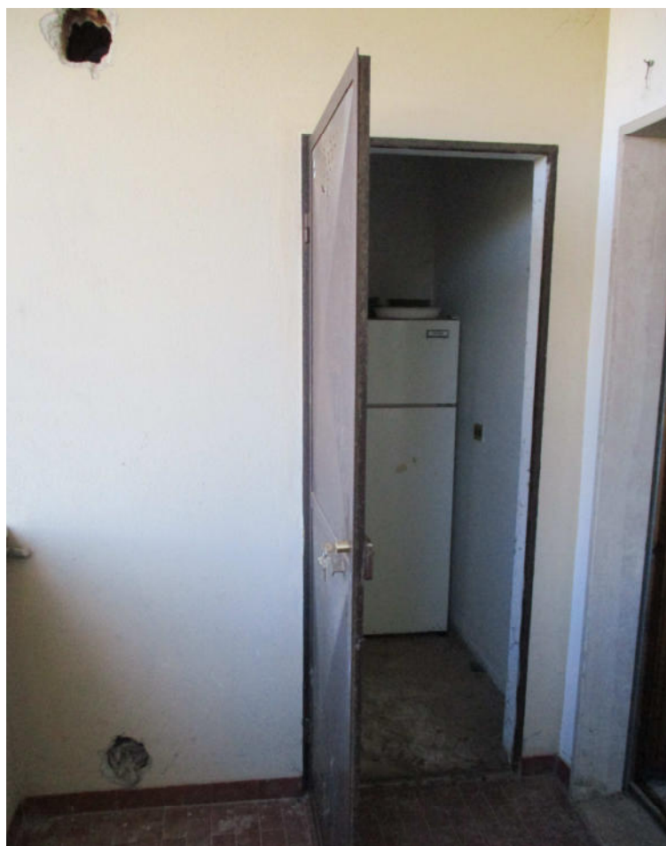
Balcone – C.T.