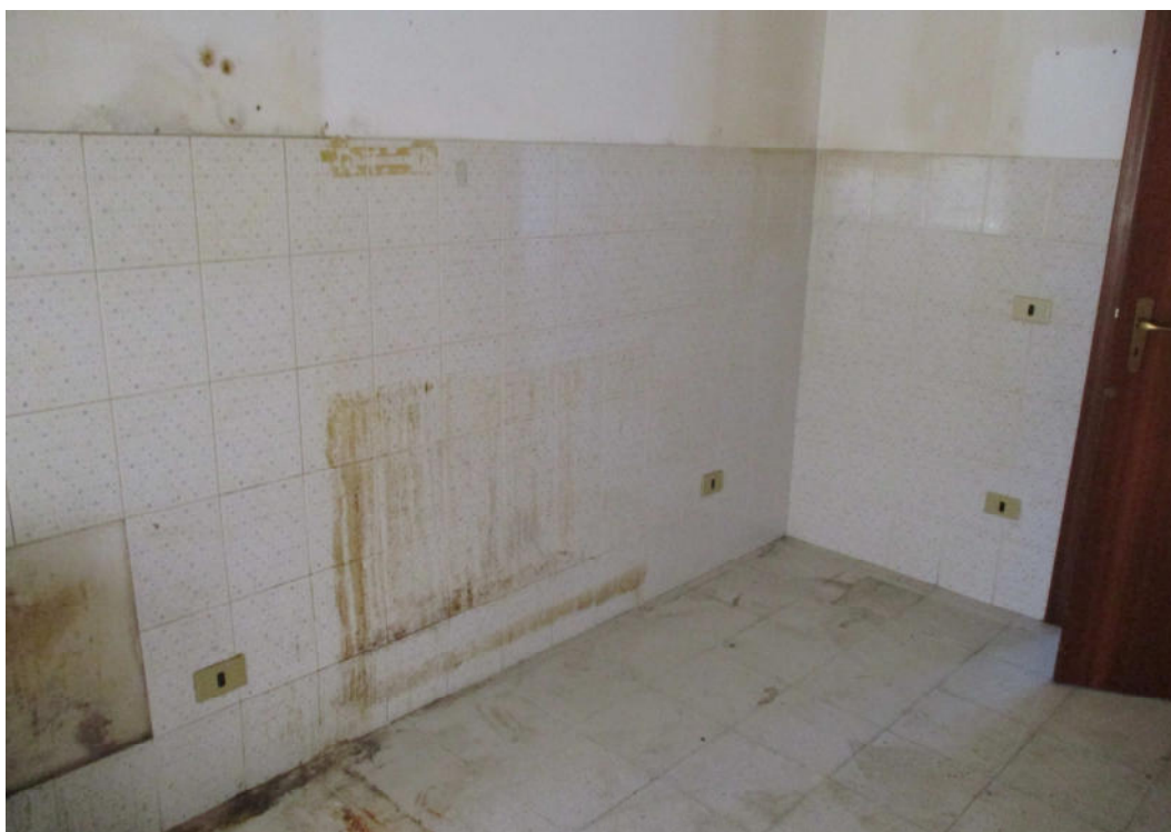
Cucina – rivestimento danneggiato