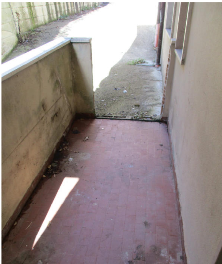
Balcone 1 – accesso non autorizzato