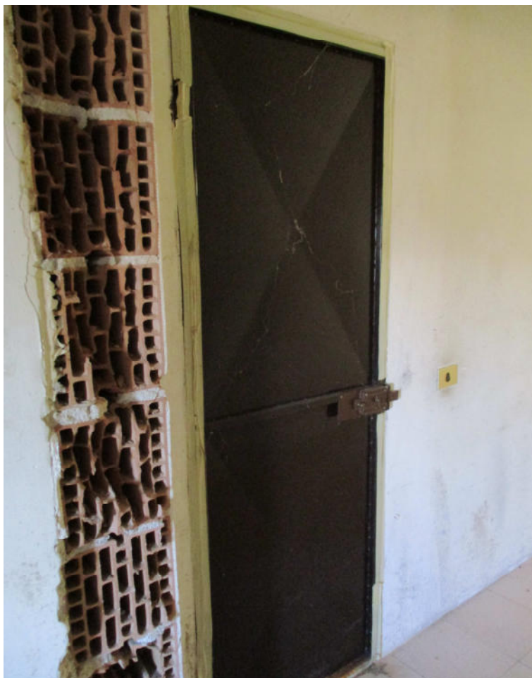
Deposito – acceso non autorizzato