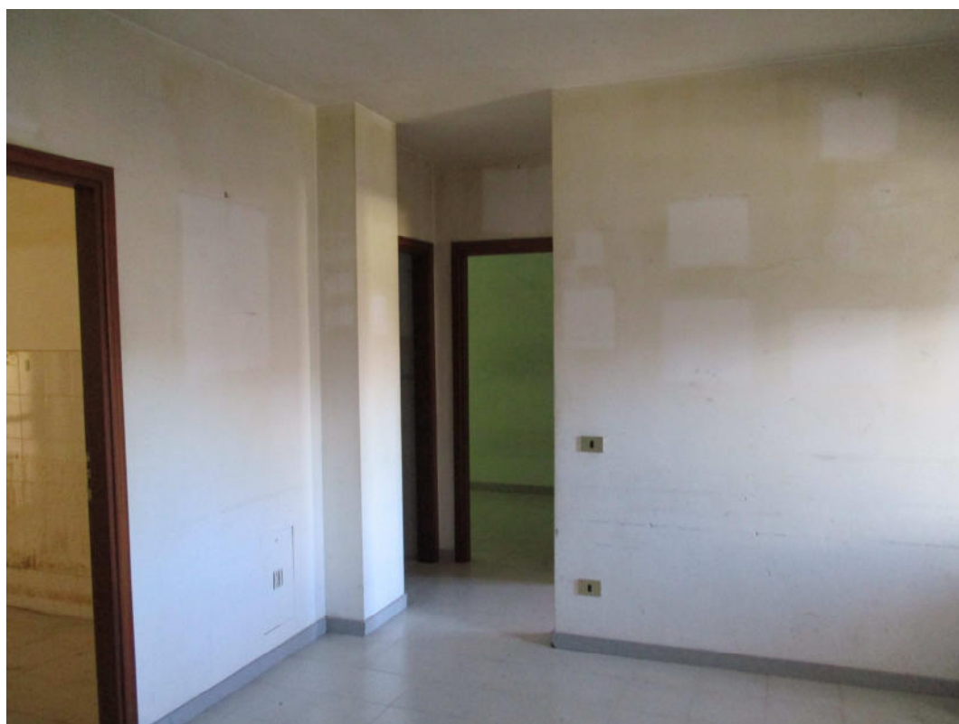
Soggiorno - Disimpegno